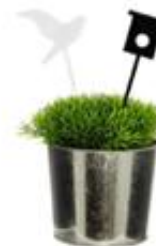
Fixa snyggaste balkongen!