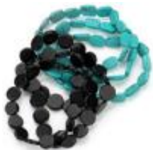
Somriga armband »

liten etta i Hollywood. Så här i efterhand tror jag att det är det bästa jag har gjort, jag lärde mig oerhört mycket på skolan jag gick på och också att bli mer öppen.