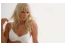
Mode: Underbara under »