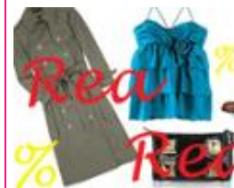
Så gör du bästa fynden på rean