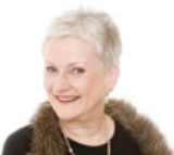
"Har dildon förstört mitt sexliv?"