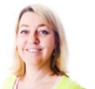
Binda eller inte binda räntorna?