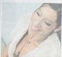
Theodora Neuzil är en av de mest kända dansarna i Hollywood. Hon har varit med i flera filmer, och hon har varit med i flera filmer.

Jag har varit USA-konplex, men jag vill inte bli en av dem som bara dansar för att se ut som en tjej.