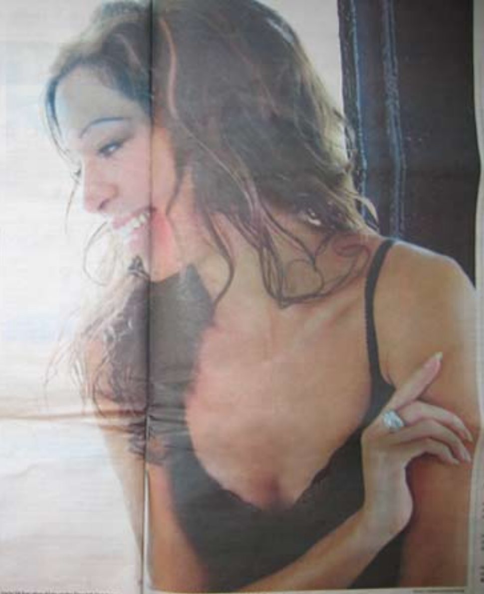
Theodora Neuzil är en av de mest kända dansarna i Hollywood. Hon har varit med i flera filmer, och hon har varit med i flera filmer.

... jag har gjort gamla heliga saker, men det betyder inte någonting. Det var inte till att alla förtjänade inte att se mig på ett bra sätt. Det är inte mitt jobb.