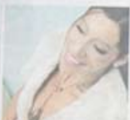
Thelma Houston är tillbaka i musiklivet efter ett långt frånvaro.

Jag har varit i USA i 15 år. Jag har varit i USA i 15 år. Jag har varit i USA i 15 år.