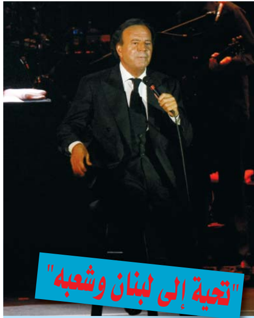
"تحيةة إلى لبنان وشعبه"

اضطرت المغنية الأمريكية بريتنى سبيرز إلى قطع إحدى حفلاتها الموسيقية في فانكوفر بكندا وذلك بسبب دخان السجائر داخل القاعة. وذكر أحد المواقع الإلكترونية الألمانية أن المتحدث باسم بريتنى خرج إلى الجماهير بعد 20 دقيقة من بدء الحفل وقال: "لن نواصل الحفل إذا استمر تدخين السجائر". وأضاف المتحدث: "إنه أمر خطير أن تواصل بريتنى الغناء في هذه الظروف". إلا أن سبيرز عادت مرة أخرى لاستكمال الحفل بعد توقف 40 دقيقة.