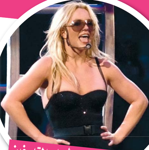
أوقفت حفلة من أجل التدخين

اضطرت المغنية الأمريكية بريتنى سبيرز إلى قطع إحدى حفلاتها الموسيقية في فانكوفر بكندا وذلك بسبب دخان السجائر داخل القاعة. وذكر أحد المواقع الإلكترونية الألمانية أن المتحدث باسم بريتنى خرج إلى الجماهير بعد 20 دقيقة من بدء الحفل وقال: "لن نواصل الحفل إذا استمر تدخين السجائر". وأضاف المتحدث: "إنه أمر خطير أن تواصل بريتنى الغناء في هذه الظروف". إلا أن سبيرز عادت مرة أخرى لاستكمال الحفل بعد توقف 40 دقيقة.